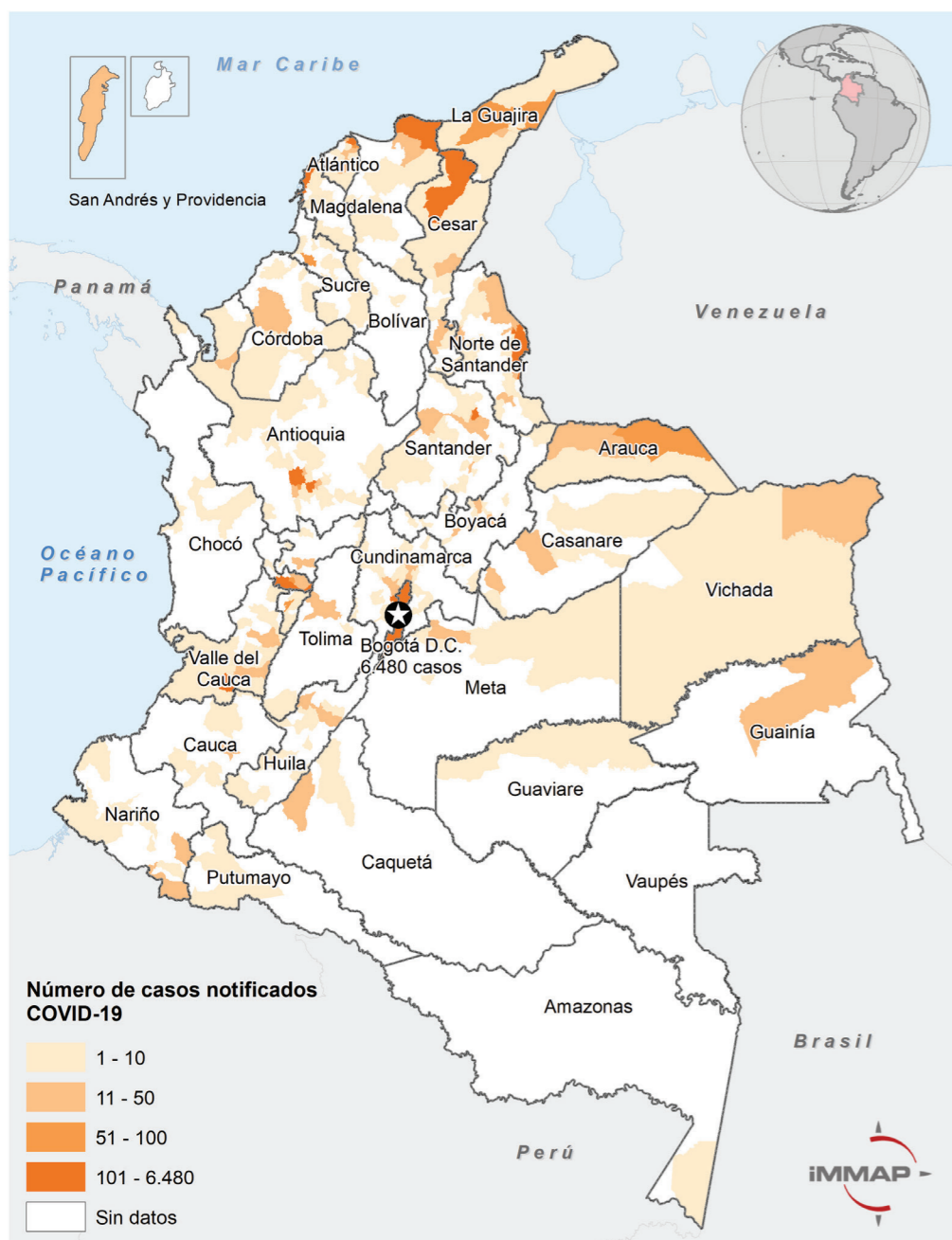
Casos de COVID 19 de población migrante venezolana en Colombia por departamentos